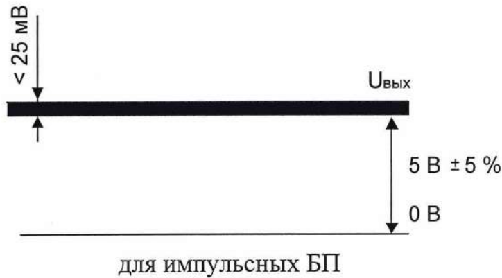
Рисунок 2 – Осциллограмма пульсаций выходного напряжения

4.7 Электрическую прочность изоляции испытывать по ГОСТ Р 52931 на пробойной установке мощностью не менее 0,25 кВ·А на стороне высокого напряжения при отсутствии внешних соединений.